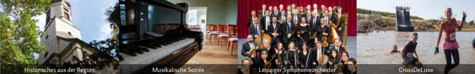
Historisches aus der Region

Zinnfigurenmuseum im Torhaus Dölitz 10–17 Uhr ermäßigter Eintritt: 3 €