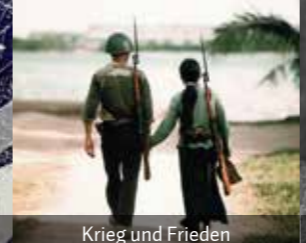
Krieg und Frieden