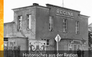
Historisches aus der Region