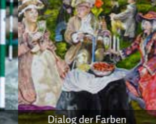
Dialog der Farben